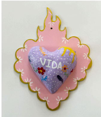
Veronica Avila Highwood Public Library & Community Center

¿Qué ha significado este programa para ti en términos de tu conexión contigo mismo/a?