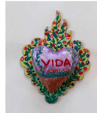
Amelia Bustamante Roberti Community House

“Creo que definitivamente ha cambiado de forma positiva mi forma de interactuar con los demás. Siento que ser parte del programa me preparó para escuchar más, tanto a mis emociones como de los demás, y me siento más paciente y alegre de ver a mi familia.”