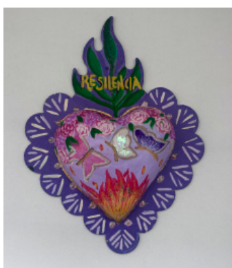
Dulce A Gonzalez Highwood Public Library & Community Center

“Me ayudó a estar más tranquila en momentos de estrés, angustia, a ser más tolerable.”