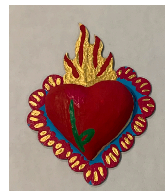
Veronica Elizabeth Mena Highwood Public Library & Community Center

¿Qué ha significado este programa para ti en términos de tu conexión contigo mismo/a?