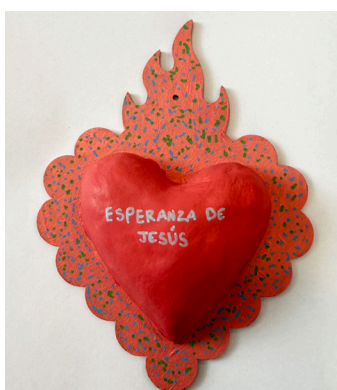
Jorge Rosales Highwood Public Library & Community Center

"Recordando que el corazón tiene razones que la razón no puede conocer. Desentrañando, enraizando, centrando, creando de nuevo. Existe un regalo natural en el interior de todos nosotros para sanarnos a nosotros mismos y los unos a los otros a través del bosque."