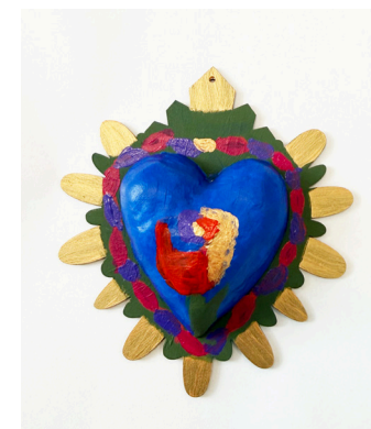
Iman Myers Roberti Community House

"Encontré cualidades que no sabia que yo tenía y como sacarlas."