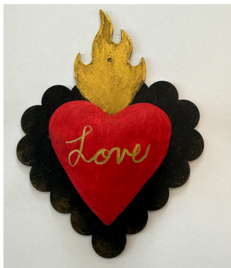
Claudia Garcia Rivera Roberti Community House

¿Cómo ha cambiado este programa tu conexión con la naturaleza?