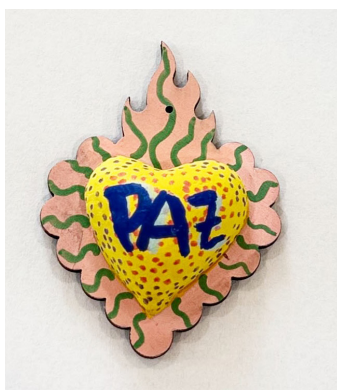
Regla Lemus Roberti Community House

"Conexión con la tierra, mi esencia, regresar a mis raíces, la madre tierra, como un madre la tierra te brinda lo que necesitas, es tu elección utilizar los recursos, un camino de paz y tranquilidad, símbolo: un árbol - es fuerza - resistencia a todas - las inclemencias. Resiliencia."