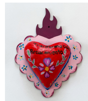
Karina Ochoa Highwood Public Library & Community Center

"Recordé que cuando estoy estresado camino, cuando necesito pensar o necesito consuelo camino, me hace sentir libre y puedo hablar del problema sin nadie que me moleste, y ahí fuera, solo mi opinión cuenta."