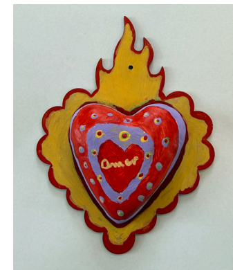
Esperanza Tellez Roberti Community House

"Mi experiencia más cercana a mi familia. Este programa me ayudó a comprender muchas cosas que yo no sabía y este programa me ayudó a comprender muchas cosas muy importantes."