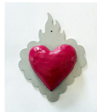
Aurora Iglesias Highwood Public Library & Community Center

“Me he sentido más conectada, aprendí a escuchar los sonidos de la naturaleza, los árboles cuando les toca el viento, el sonido es único. Los pájaros cantando, el sonido de las olas del lago al romperse, es algo tranquilizante, hay algo que tranquiliza tu sistema o a ti... y así es como me siento conectada me da paz.”