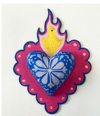
Viri Gonzalez Highwood Public Library & Community Center

¿Cómo ha cambiado este programa tu conexión con la naturaleza?