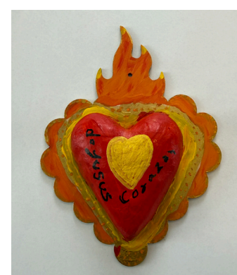
Florencia Izoteco Highwood Public Library & Community Center

“El cambio más importante que experimenté después de participar en TIERRA fue mi conexión con la naturaleza. Ahora aprecio mucho más la naturaleza y busco estar en espacios verdes con mayor frecuencia. He incorporado caminatas cortas y baños de bosque antes del trabajo o durante la hora del almuerzo.”