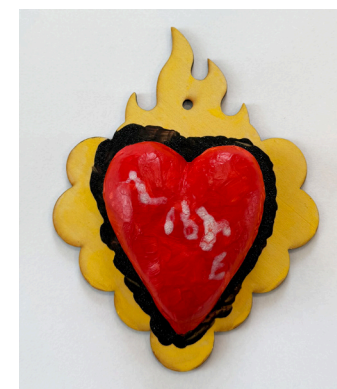
Mario Tellez Roberti Community House

" Mas consciencia sobre la naturaleza. Necesitamos la naturaleza, me hace sentir más saludable."