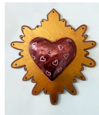
Fabiola Hernandez Highwood Public Library & Community Center

“Tener más comunicación con la persona respeto y callar.”