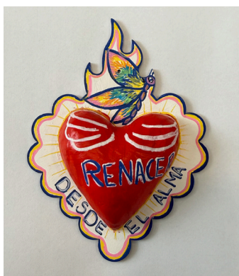
Laura Lara Highwood Public Library & Community Center

"Ha cambiado mucho hoy que estamos en invierno me abrigo adecuadamente, disfruto de la blanca nieve y si no hay nieve, doy lena caminata por algunos minutos. Gracias a TIERRA, cambio mi vida."