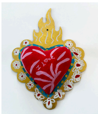
Esmeralda Rivera Roberti Community House

"Amo la naturaleza, entonces me siento más presente cuando estoy afuera, lo disfruto más en todas las estaciones. También he aprendido a amar cada clima en la naturaleza."