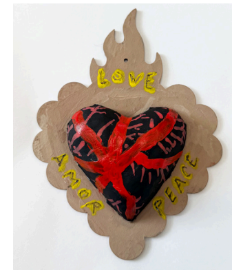
Miguel A Camacho Roberti Community House

“Vida, Amor, Paciencia, Relajación, Reflexión, Amar todo clase de vida, Aprender a vivir los recuerdos que nos hacen sentir bien, Saber que la medicina está en el bosque, en el jardín pa que puede ser cualquier planta puede ser tu alivio.”