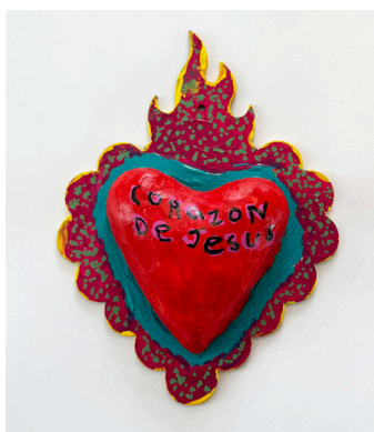
Laura Gaytán Highwood Public Library & Community Center

“A cambiando en mucho, ahora pongo más atención en cómo caen las hojas, los insectos, el viento, y muchos detalles más que antes no creían que eran importantes.”