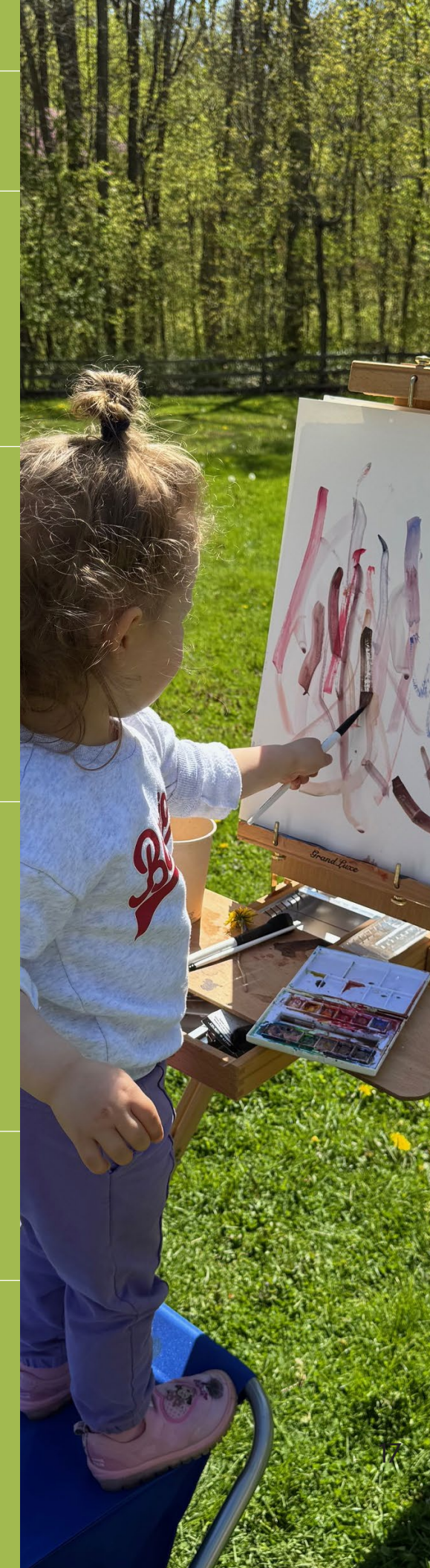
FOTO: An artista floreciente en el Mercado de la Madre Tierra.

¡Ayude a que la misión de Brushwood prospere! HAGA UNA DONACIÓN HOY Escanee el código QR